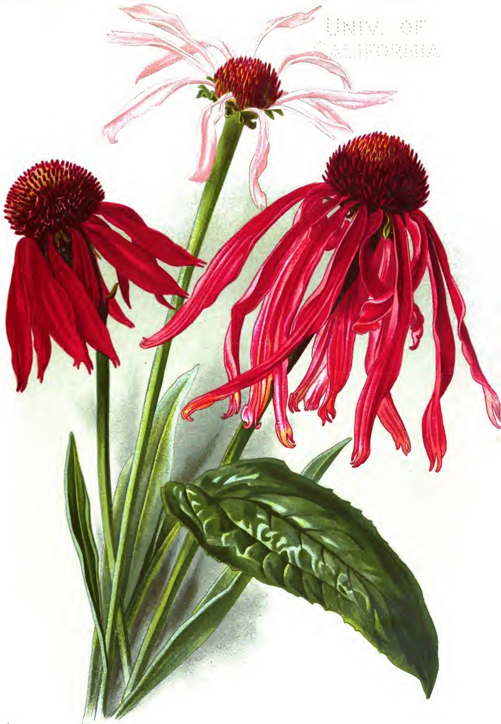
Echinacea purpurea Mnch. ( Rudbeckia purpurea L.) Echinacea angustifolia D. C.